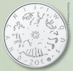
Jubileumsmynt för läsfärdigheten

Kom med och delta i fortbildning och andra läslusthändelser. Bekanta dig med material som riktas till skolor och bibliotek och med dina lokala läslustaktörer.